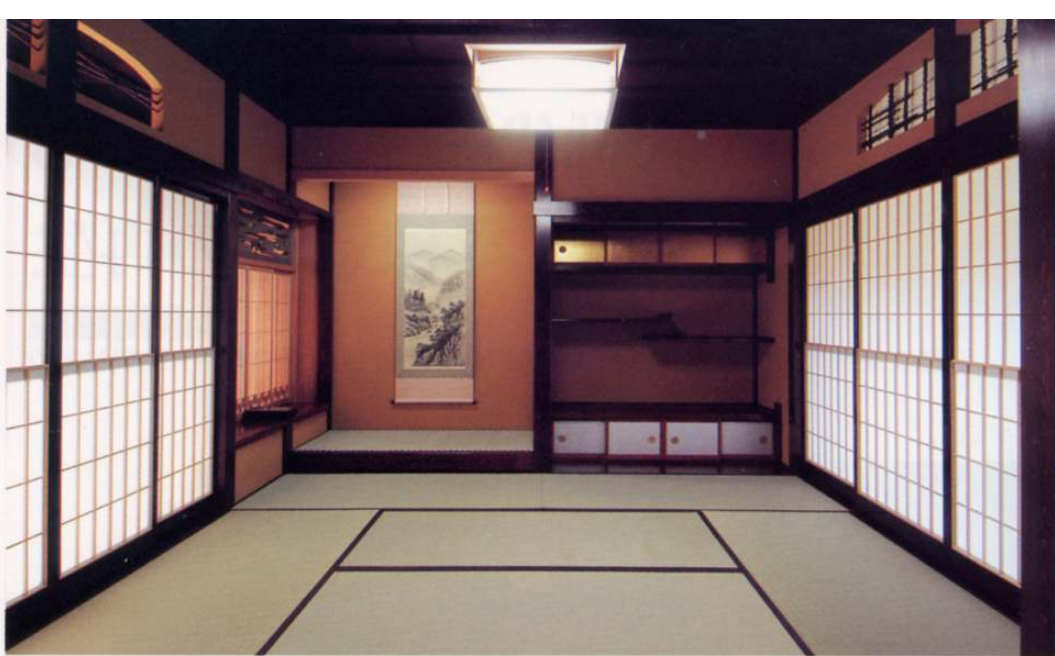
和室8畳 広間としても利用できる、本格的な書院づくり。呂色漆塗りは5回重ね塗りをするほど、本格的な趣向がこらされている。

外観 母屋とはL型に配置し、草庵風に。屋根は日本瓦葺きで、入母屋づくり。ステンレス横葺きの出庇は3尺と深く、化粧垂木が美しい。