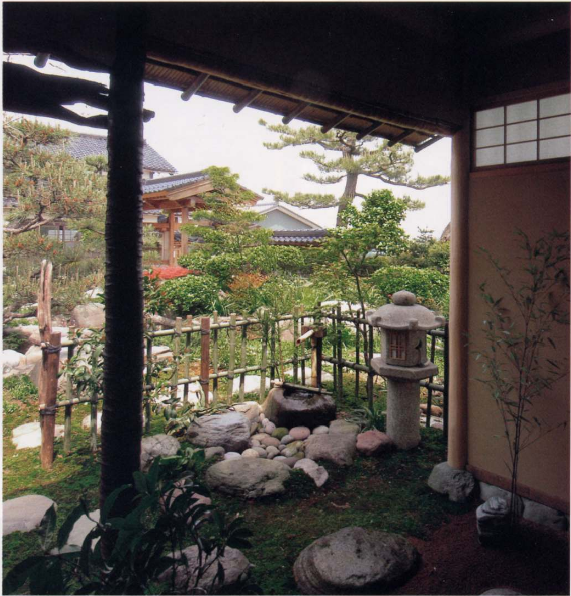
つくばいを見る つくばいは手を清め、精神統一をはかる役目をする。手水鉢、ろうそくを置く手燭台等で構成。ここから四季の変化が楽しめるよう工夫されている。