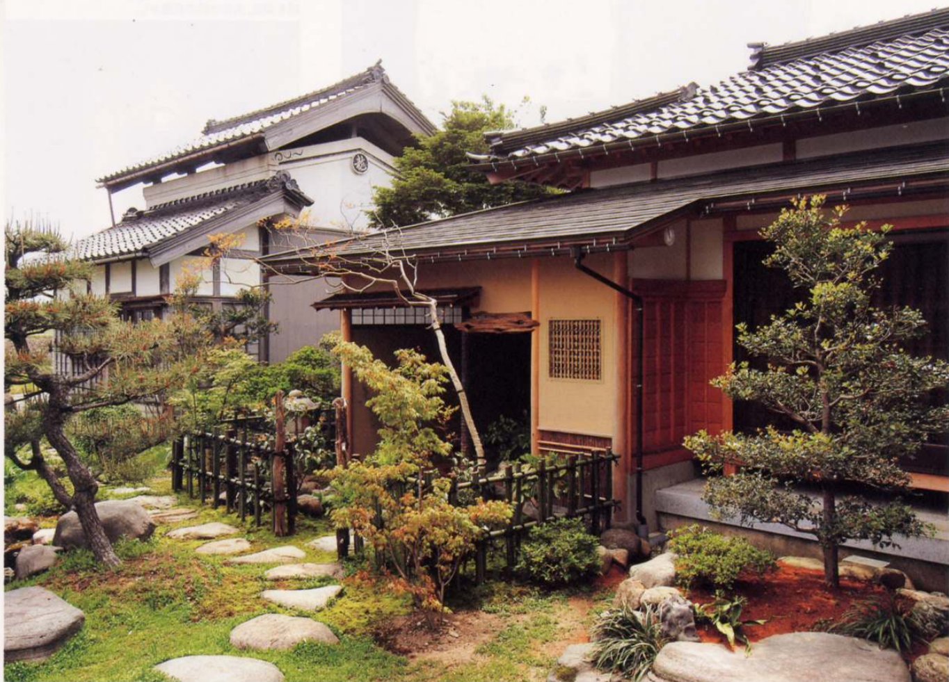
外観 母屋と一体感を持つ広い庭園から入る茶室は、竹垣を境としている。

K邸(施主:75歳) 富山県南砺市 家族構成:夫婦 構造:木造軸組工法 延床面積:53.00㎡(16.03坪) 総工事費(茶室):1,600万円