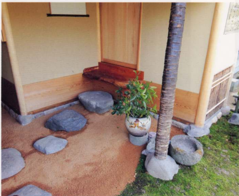
中露地を入れる 北日本は冬が長く雪や雨が多いため、露地も中露地にする配慮がなされている。土間は赤土のタタキ。