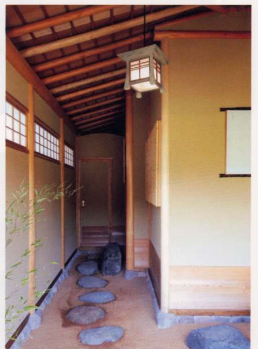
中露地 屋根勾配を生かした杉の化粧垂木が美しい木舞仕上げの中露地。