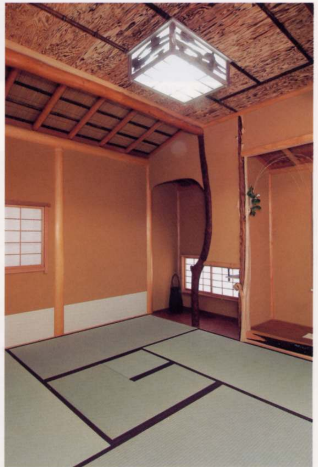
小間4畳半 天井は「わび」「さび」を表現するため、杉をバーナーで焼くなど手が込んだ仕上げに。